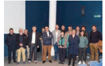
Les membres du nouveau comité syndical et les deux coprésidents de l'association des commerçants

17 511 visiteurs renseignés à la Maison du Site pour 10 604 demandes traitées à l'accueil, 88 % de français et 12 % d'étrangers (Allemagne > Belgique > Italie > Suisse > Espagne).