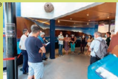
Vernissage exposition du Groupe des Bruyères