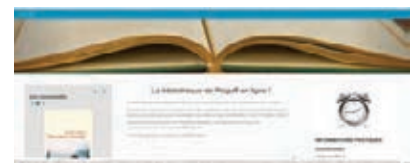
Page d'accueil de notre nouveau site

De nombreuses personnes utilisent encore notre ancien site en ligne qui malgré nos demandes n'a toujours pas été désactivé. Ce site n'est plus à jour, alors n'hésitez pas à visiter notre nouveau site à l'adresse suivante : https://bibliotheque.plogoff.fr/ Vous pourrez ainsi consulter notre catalogue et réserver vos livres en ligne. Si vos anciens codes ne fonctionnent plus nous pourrions vous en créer de nouveaux. Tel : 02 98 70 37 97 ou 09 62 63 65 47 Mail : bibli.plogoff@gmail.com